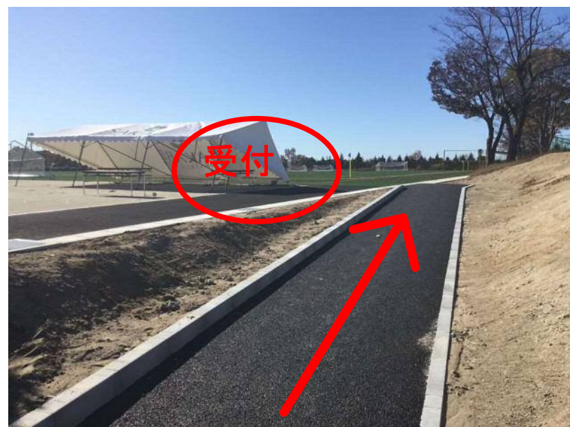
⑥ゆるい坂をのぼった左手が受付