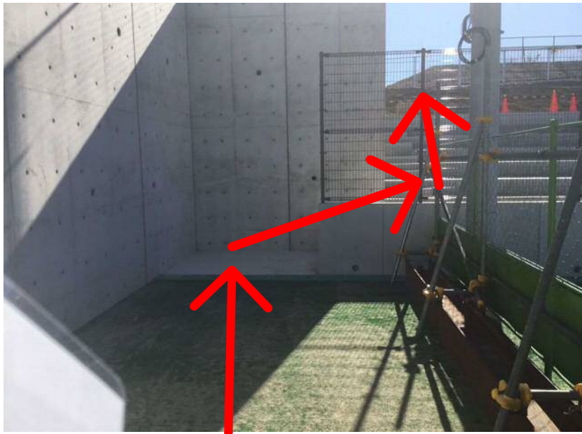
③突き当りを右、左でテニスコート脇の階段をのぼる