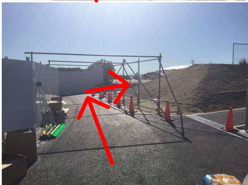
⑤アスファルトの上をグラウンド方向に歩く